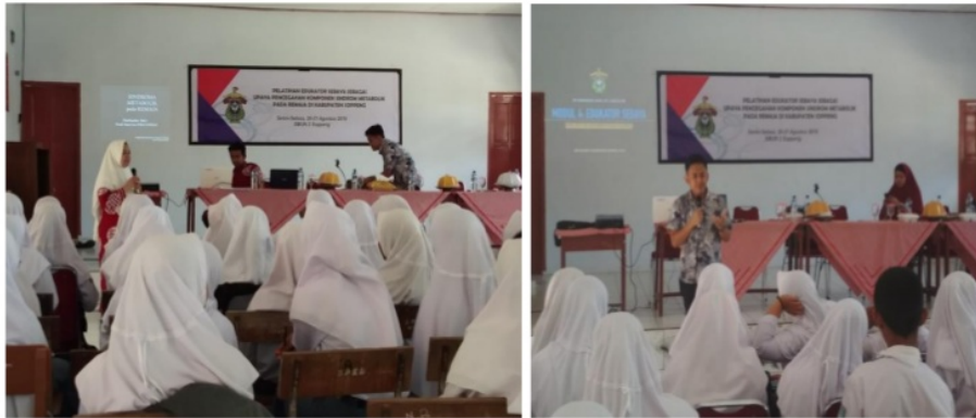
Gambar 1. Penyampaian materi

Setelah penyampaian materi, peserta kemudian diberikan demonstrasi cara melakukan pengukuran antropometri pada remaja (Gambar 2). Hasil pengukuran tersebut akan digunakan untuk menghitung Indeks Massa Tubuh yang dibutuhkan untuk menentukan risiko Sindrom 8 metabolik pada remaja. Pengukuran antropometri yang dilakukan adalah pengukuran berat badan menggunakan timbangan seca serta pengukuran tinggi badan menggunakan mikrotolis.