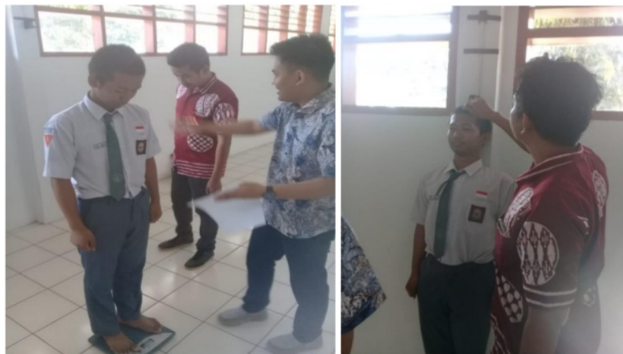
Gambar 2. Demonstrasi pengukuran antropometri remaja

Sebagian besar peserta kegiatan ini berasal dari SMUN 4 Soppeng, sebagai tempat pelaksanaan kegiatan, yaitu 54.00% dan sisanya dari SMUN 8 Soppeng sebanyak 46.00%. Sedangkan SMUN 1 Soppeng tidak mengirimkan utusan pada kegiatan tersebut karena ada agenda sekolah yang tidak bisa diganggu. Sehingga peserta kegiatan yang awalnya direncanakan berasal dari 3 sekolah, pada realisasinya 11 asal dari 2 sekolah mitra saja. Karakteristik peserta edukasi gizi terlihat pada tabel 1 sebagai berikut: